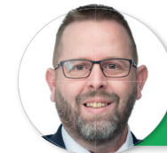
par Cédric Pilatti, Dessinateur-Projeteur

Plus de 8'000 nouveaux permis G actifs ont fait leur apparition à Genève depuis juin 2022. L'UDC appelle les autorités à prendre la mesure de cette situation dramatique pour la population locale.