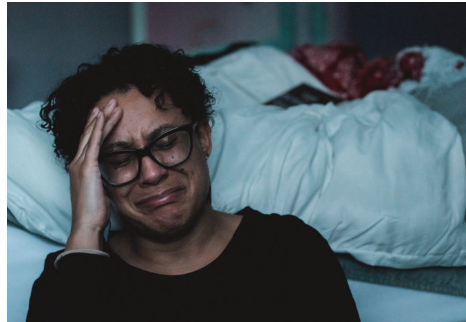
Les violences subies par les femmes sont en augmentation. La gauche et une grande partie de la classe politique refusent de reconnaître qu'une grande partie du problème réside dans l'immigration subie.

Mais ce n'est pas tout. Alors que des milliers de féministes défilaient le 14 juin dernier lors de la grève féministe, leurs soutiens roses-verts à Berne refusaient d'infliger des peines de prison ferme aux violeurs. Le ténor socialiste Carlo Sommaruga expliquait qu'il s'agissait de « rendre aussi des peines qui soient en relation avec la gravité de l'acte » dans des « cas relativement bénins » de viol. Il était ensuite sou-